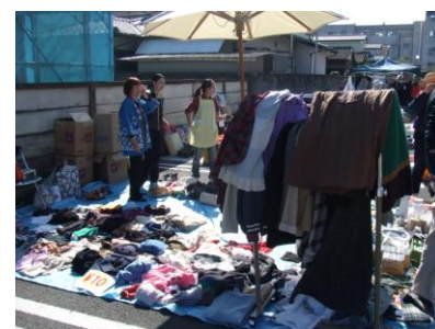
● 長生園バザーの様子(10.29)