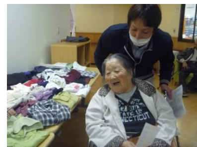
● 北勝園バザーの様子(11.19)