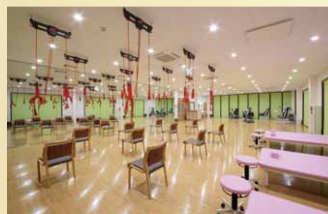
リハビリテーションルーム