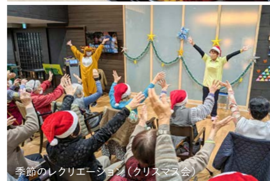
季節のレクリエーション（クリスマス会）