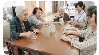
▲ 頭を使うレクリエーション