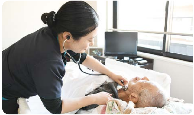
▲ 言語聴覚士(ST) による嚥下指導