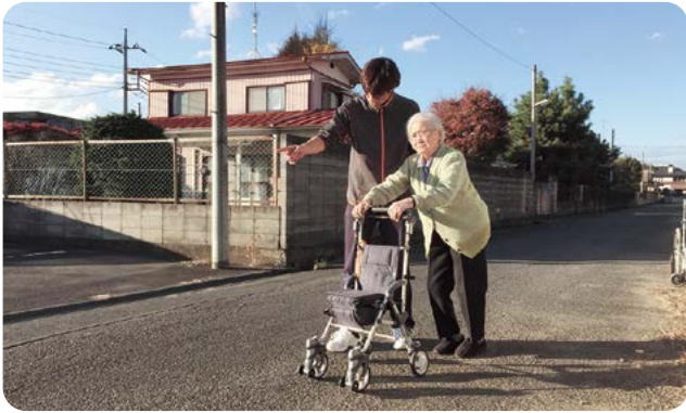
▲ 理学療法士(PT) による歩行訓練