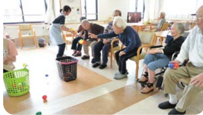
▲ 体を動かすレクリエーション