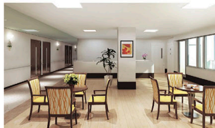
2~4階 リビング・ダイニングルームイメージ